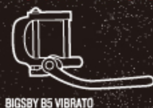
BIGSBY B5 VIBRATO